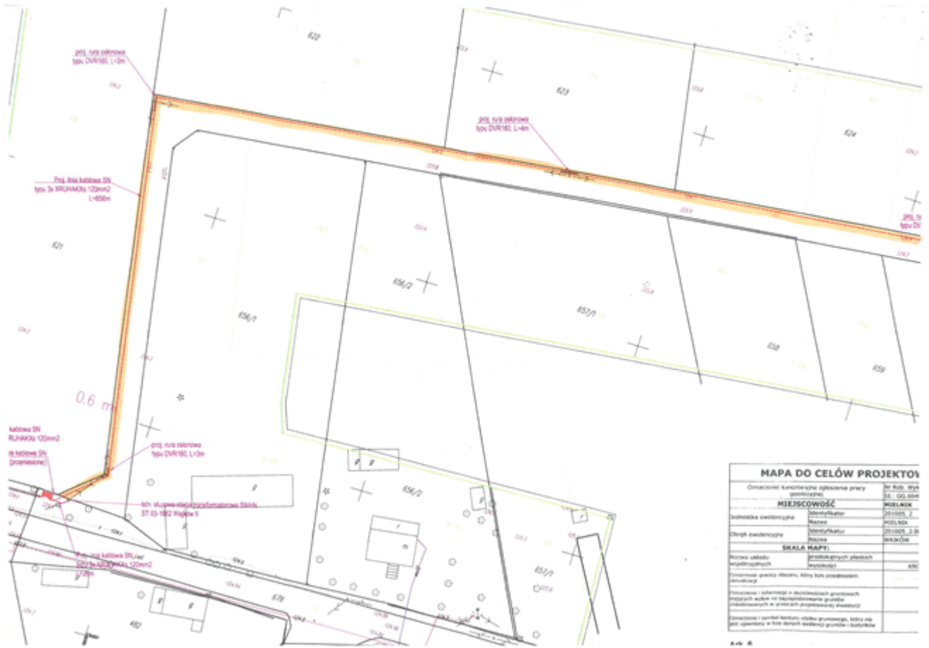
Mapa nr 1