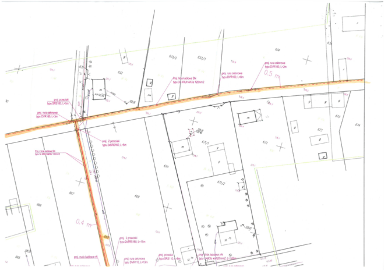
Mapa nr 3