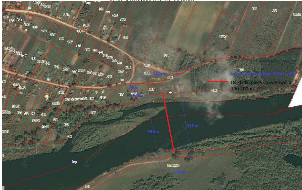
Rys: Umiejscowienie obiektu

1.1. Teren opracowania konkursowego znajduje się w północno-wschodniej części Gminy Mielnik a zarazem Województwa Podlaskiego, na styku Białorusi i Województwa Lubelskiego, oraz Gminy Konstantynów położonej w północno-wschodniej części Powiatu Białskiego. Obejmuje on obszar oznaczony na poniższym rysunku. Mapa do celów projektowych z uzbrojeniem terenu znajduje się w części B regulaminu konkursu.